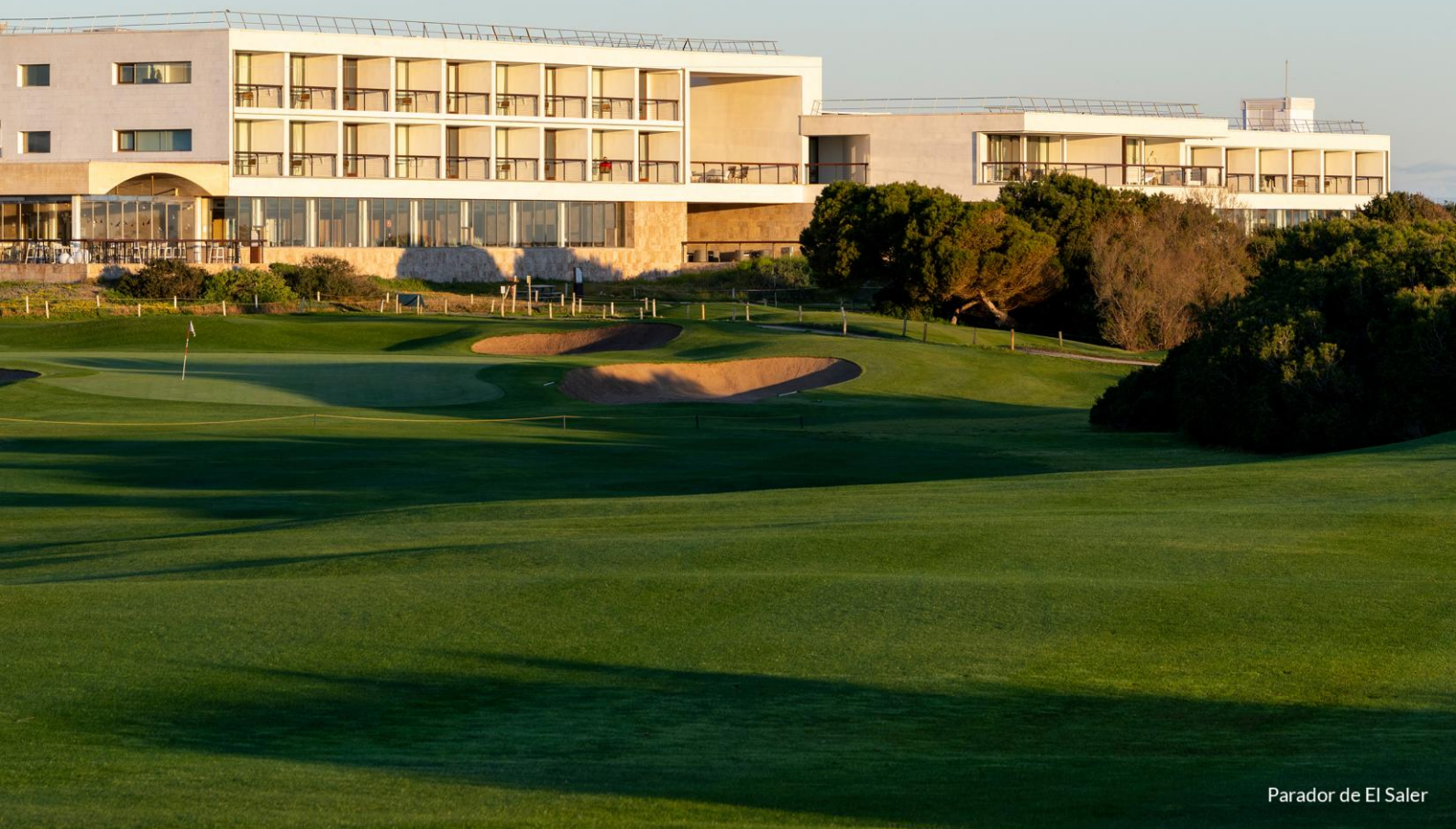
Parador de El Saler

Descuento aplicable exclusivamente sobre la Tarifa Parador vigente, en régimen de alojamiento y desayuno