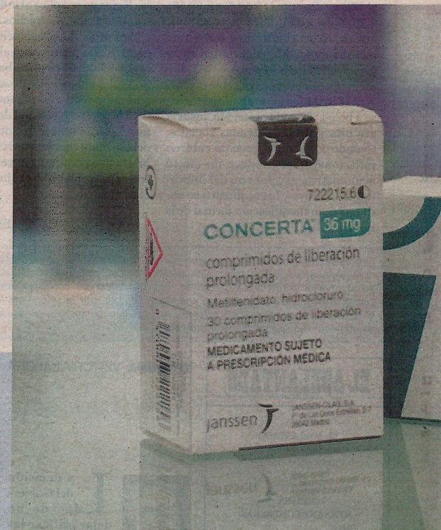
Concerta y Ozempic están entre los fármacos más buscados.

“NO DAMOS OZEMPIC A PERSONAS QUE VENGAN CON RECETAS PRIVADAS, SOLO A LAS QUE VENGAN DESDE LA SEGURIDAD SOCIAL. ES LA MANERA DE GARANTIZAR QUE LLEGUE A LOS PACIENTES DIABÉTICOS”