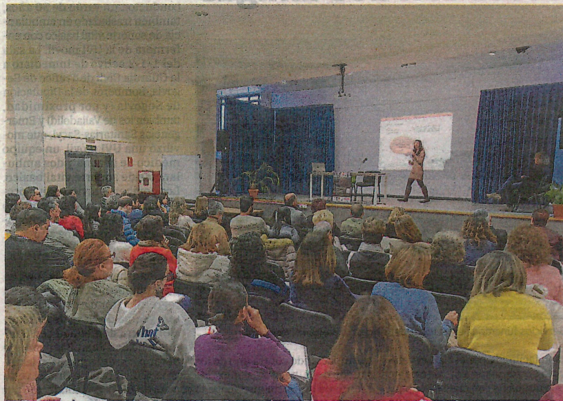
Jornada sobre la TDAH celebrada ayer en Segovia. ÓSCAR COSTA

El pasado mes de enero había programado una jornada en el Centro Cultural de San José que contaba con más de 70 inscritos y en la que estaba prevista la participación de representantes de las nueve asociaciones que hay en la comunidad, en las siete capitales de provincias restantes, junto con Ponferrada y Miranda de Ebro. Las condiciones meteorológicas adversas, con una abundante nevada que desaconseja