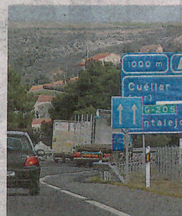
AP-601. A. DE TORRE

En conjunto, el personal sanitario tuvo que atender finalmente a cinco personas, una mujer de 34 años, un varón y tres menores de 1, 7 y 12 años, que fueron trasladados con posteriori-