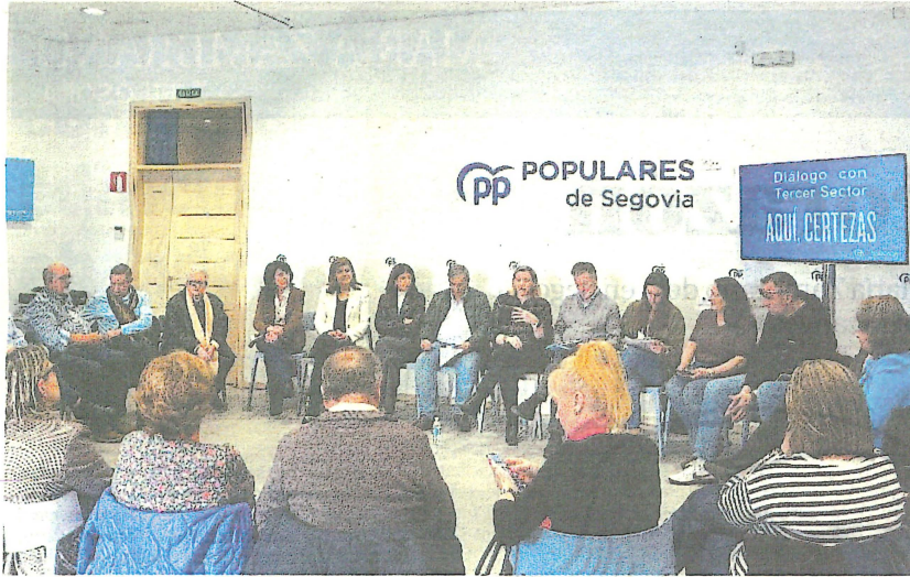
La consejera de Familia, junto a los candidatos populares, en la reunión con las asociaciones del Tercer Sector.